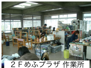
2F めふプラザ 作業所